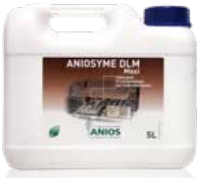
Aniosyme DLM Maxi 5 L tanica Codice d'ordine: AN1920038

Detergente tri-enzimatico leggermente alcalino per un eccellente riprocessamento degli strumenti chirurgici