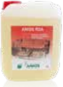
Anios RDA 5 L tanica

Agente neutralizzante di risciacquo, attivatore di asciugatura