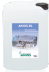
Anios RL 10 L tanica