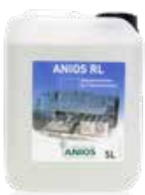
Anios RL 5 L tanica

Agente di risciacquo per la strumentazione