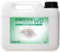
Aniosyme Synergy WD 5 L tanica Codice d'ordine: 3104720

Detergente tri-enzimatico per un sofisticato riprocessamento automatico degli strumenti