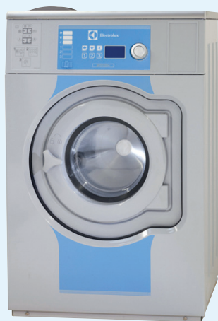
ELM ECO WASH 3000 N